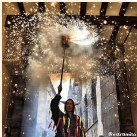
Foto guanyadora del concurs d'Instagram 2022.